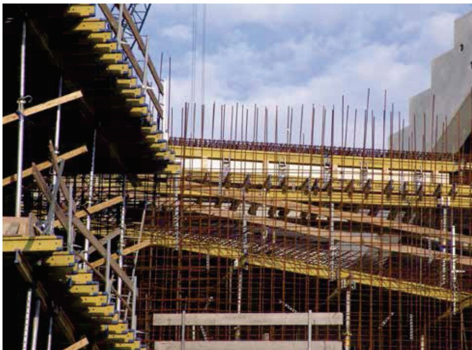
Damit die verschiedenen Rüge- und Verjährungsfristen gemäss Norm SIA 118 einheitlich zu laufen beginnen, sollten diese vertraglich koordiniert werden.

Genehmigung von Regieansätzen und Freigabe von Regiearbeiten, Freigabe von Bestelländerungen und Abnahme des Werks.